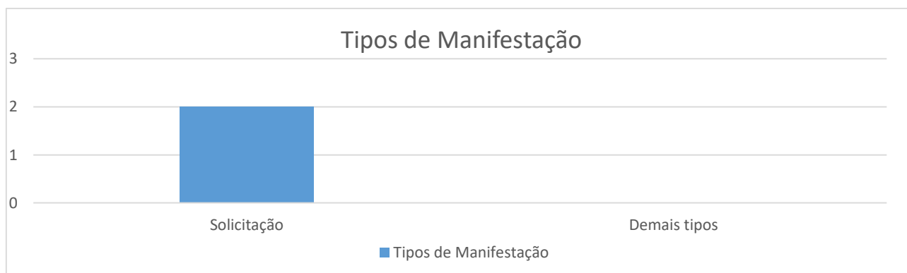
Gráfico 03 – Números de cada tipo de manifestação

Observa-se no gráfico abaixo que as manifestações mais recorrentes registradas no período foram a: Solicitação (02).