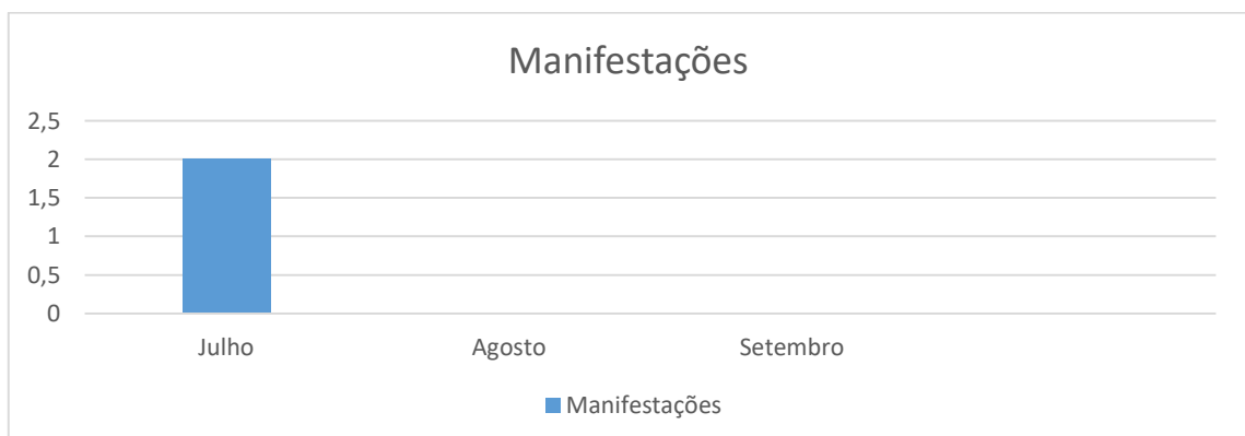
Gráfico 01 – Números de manifestações registradas no período

No período a Ouvidoria da Prefeitura Municipal de Catiguá recebeu 02 (duas) manifestações. O gráfico abaixo demonstra o volume de manifestações recebidas mês a mês: